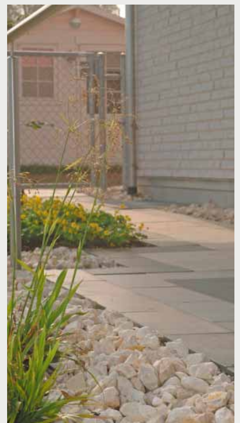
Die Kiesschüttung neben dem Plattenweg wirkt freundlich und modern - der GaLaBauer aus der Schweiz baut alle Stilrichtungen für seine Kunden.