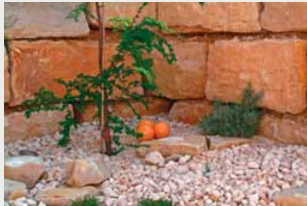
Liebevoll gestaltete Details sind das I-Tüpfelchen bei der Gestaltung mit Natursteinen.