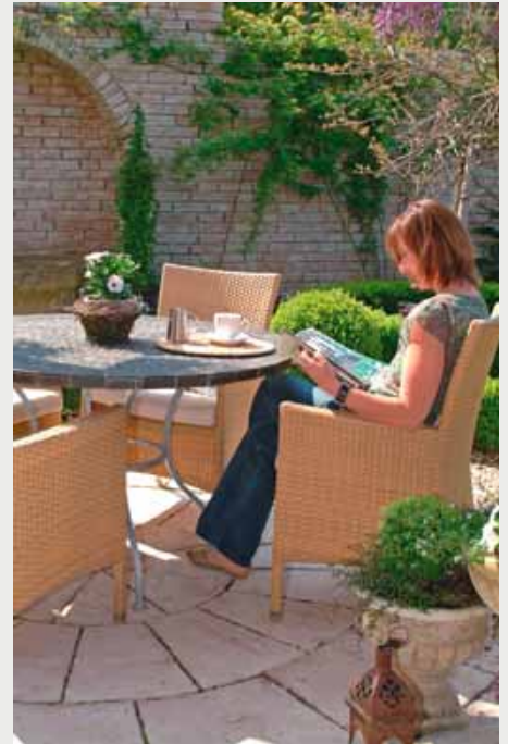
„Der Kunde steht im Mittelpunkt aller Prozesse und soll sich nachhaltig an der Gartengestaltung erfreuen,“ so Firmenchef Ernst Deiss aus der Schweiz.

zufriedenheit ausgerichtet. Unsere Passion ist es, die Gartenträume unser Kunden wahr werden zu lassen und für sie etwas Nachhaltiges