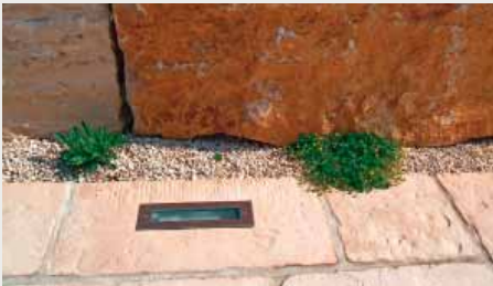
Mit gekonnter Beleuchtung lässt sich die Mauer nachts optisch näher ans Gebäude holen.

Um möglichst zielgenau auf die Kundenwünsche eingehen zu können, bittet er jeden Neukunden bzw. Interessenten zunächst einen Fra-