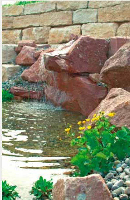
Das bewegende Element Wasser bildet einen stimmungsvollen Kontrast zum Stein.

Um möglichst zielgenau auf die Kundenwünsche eingehen zu können, bittet er jeden Neukunden bzw. Interessenten zunächst einen Fra-