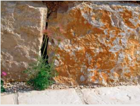
Die trocken gesetzten Steine haben ein Gewicht von 2,7 Tonnen pro Kubikmeter.