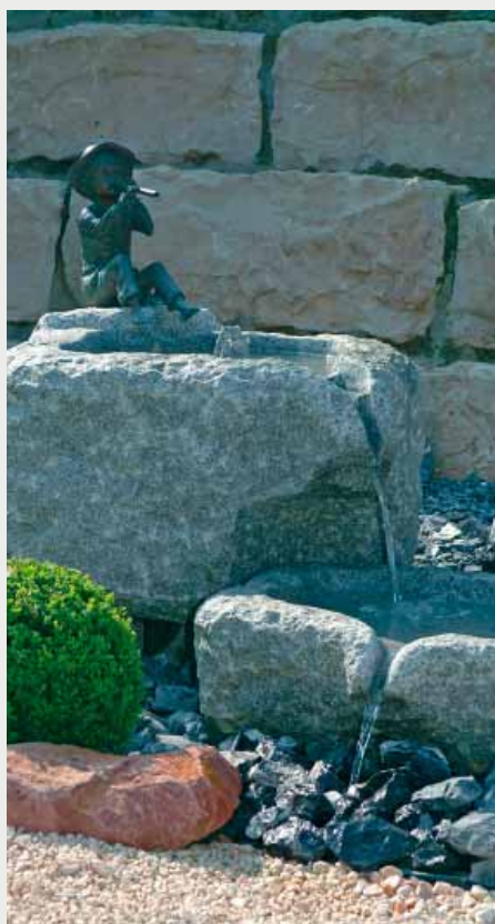
Neben Jurakalkstein verwendet die Deiss AG u.a. schwarzen Liechtensteiner Alpenkalk mit weißen Einschüssen und den harten Tessiner Granit.